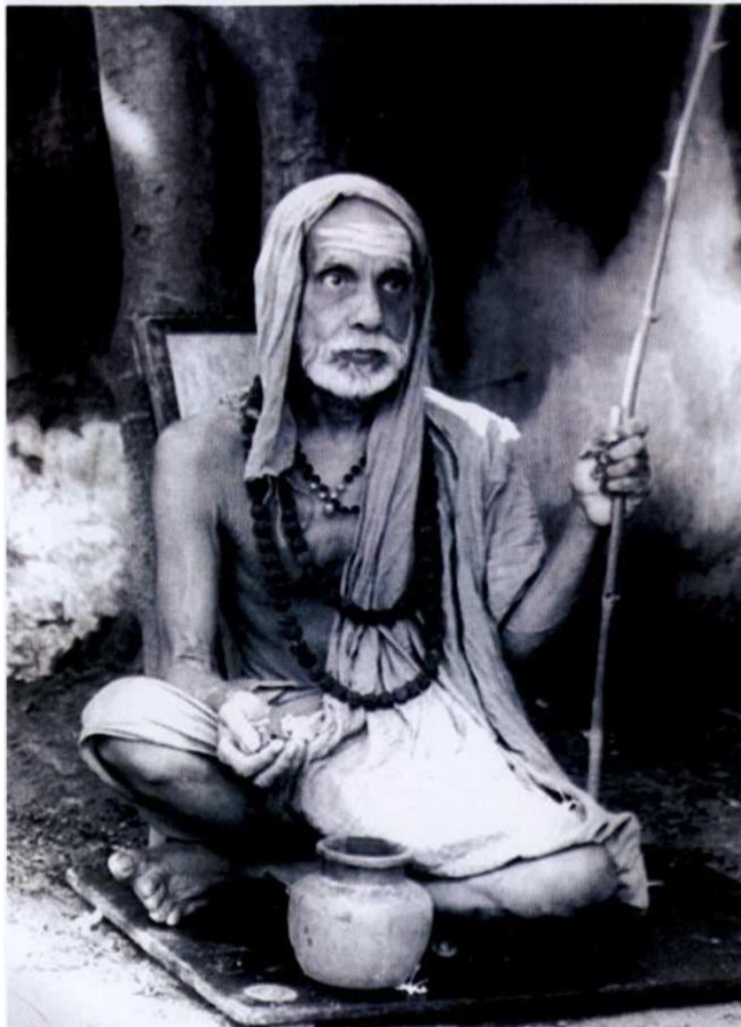
His Holiness Sri Chandrasekharendra Saraswati Swamigal of Kanchi Mutt (1894-1994)